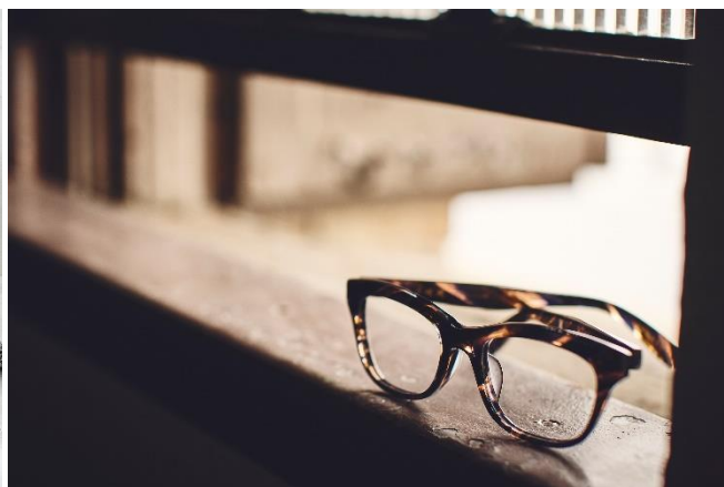
NEW SHOP イメージ (左:ピオセボン 右:カネコオプチカル)

パリ発のオーガニックライフスタイル・スーパーマーケット「ピオセボン」が横浜駅エリアに初進出！「日常使いできるカジュアルな価格」をモットーに、生産者が丁寧に育てた有機野菜や果物をはじめ、ヨーロッパから直輸入の新鮮なチーズ、パッケージを見るのも楽しい海外のお菓子やスナックも豊富に取り揃えています。「オーガニックのある暮らし」をピオセボンと一緒にスタートしてはいかがでしょうか。