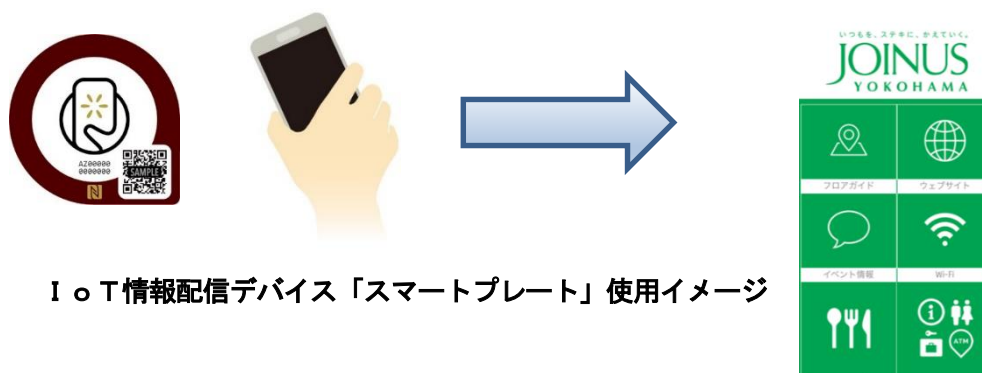
IoT情報配信デバイス「スマートプレート」使用イメージ